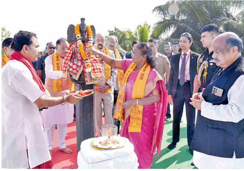
శనివారం రాష్ట్రపూర్ణిలోని జగన్మోహన్ అలయాన్ని సందర్శించిన రాష్ట్రపతి ముర్ము